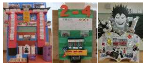
【個性が光る学級紹介パネル】

10月4日、多くの皆様にご来校いただき、生徒たちの多彩な姿をご覧いただきました。ありがとうございました。