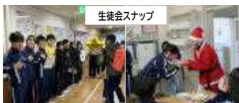
あいさつ運動(12/9~12) / クリスマス企画(12/19)

<校長のつぶやき> 「目標と覚悟」(終業式でもお話ししました) 私がこの仕事を通して、中学生から学んだことです。